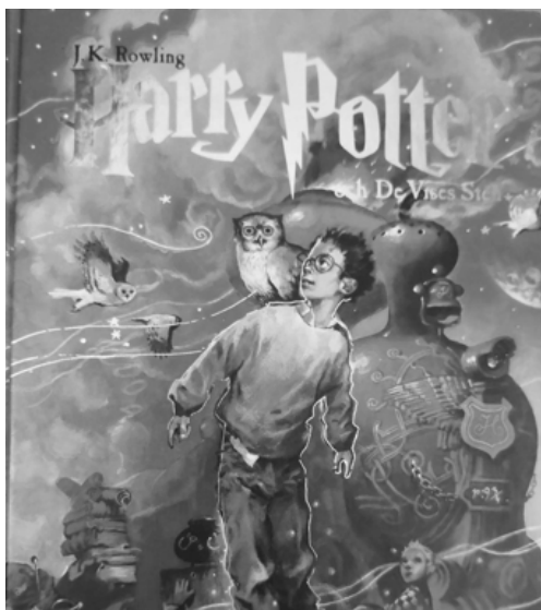
Den första boken om Harry Potter, Harry Potter and the Philosopher's Stone av J.K. Rowling utkom 1997. Det är totalt sju böcker i serien.

– Samtalen vi har liknar de samtal man brukar ha i kyrkor men kan kanske tala till fler än de som brukar gå i kyrkan.