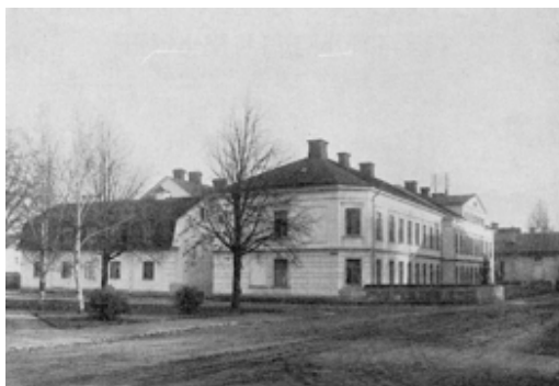
Waldenströmska Studenthemmet 1920

De som bodde på hemmet kallades hemiter, men matserveringen och gemenskapen var öppen även för andra som kallades hemäter, som under de första årtiondena var i majoritet. De kunde också tillhöra hemitkåren som anordnade fester och program. Och bland hemäterna fanns flickor med från början.