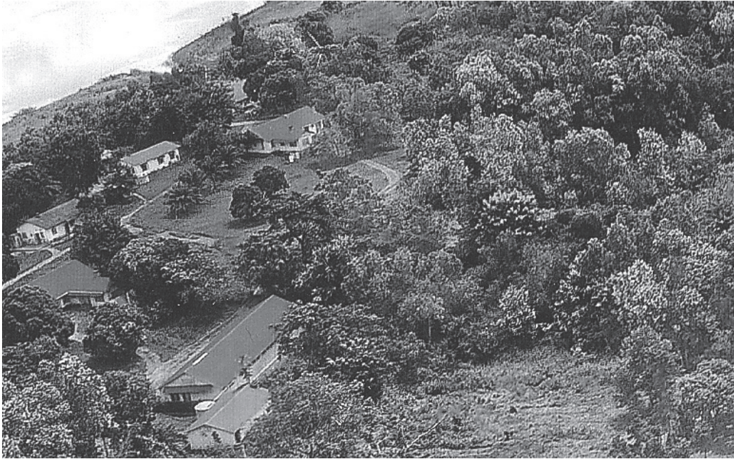
Slutningen till höger om husen är den som planterades 1995(flygbild från 2007).

läser detta och är allmänt miljö- och klimatin- tresserad – oavsett om du är medlem eller inte – kan vara med och bidra till denna viktiga inter- nationella missionsinsats för befolkningen i Luozi-området.