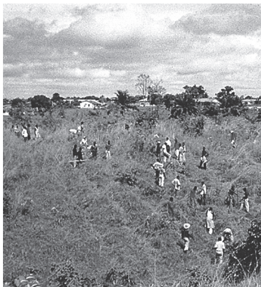
Innan bränderna härjat 1995 högs gräset ned och personalen satte trädplantor.

Uppsala missionsförsamling stöttar ett SIDA-projekt för beskogning av savannen i Luozi-regionen i Nedre Kongo i Kongo Kinshasa – Demokratiska Republiken Kongo. Projektet är en del av ett större projekt som Svenska Missionskyrkans systerkyrka i Kongo Kinshasa fått medel för.