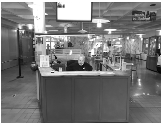
Nytt värdbord i Missionskyrkan