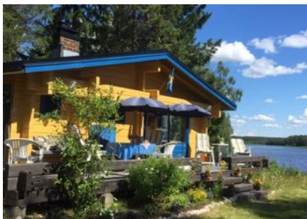
Jonssons stuga Se sid 16

Redaktionen förbehåller sig rätten att redigera och välja bland insänt material samt att lägga ut detta www.uppsalamissionskyrka.se .