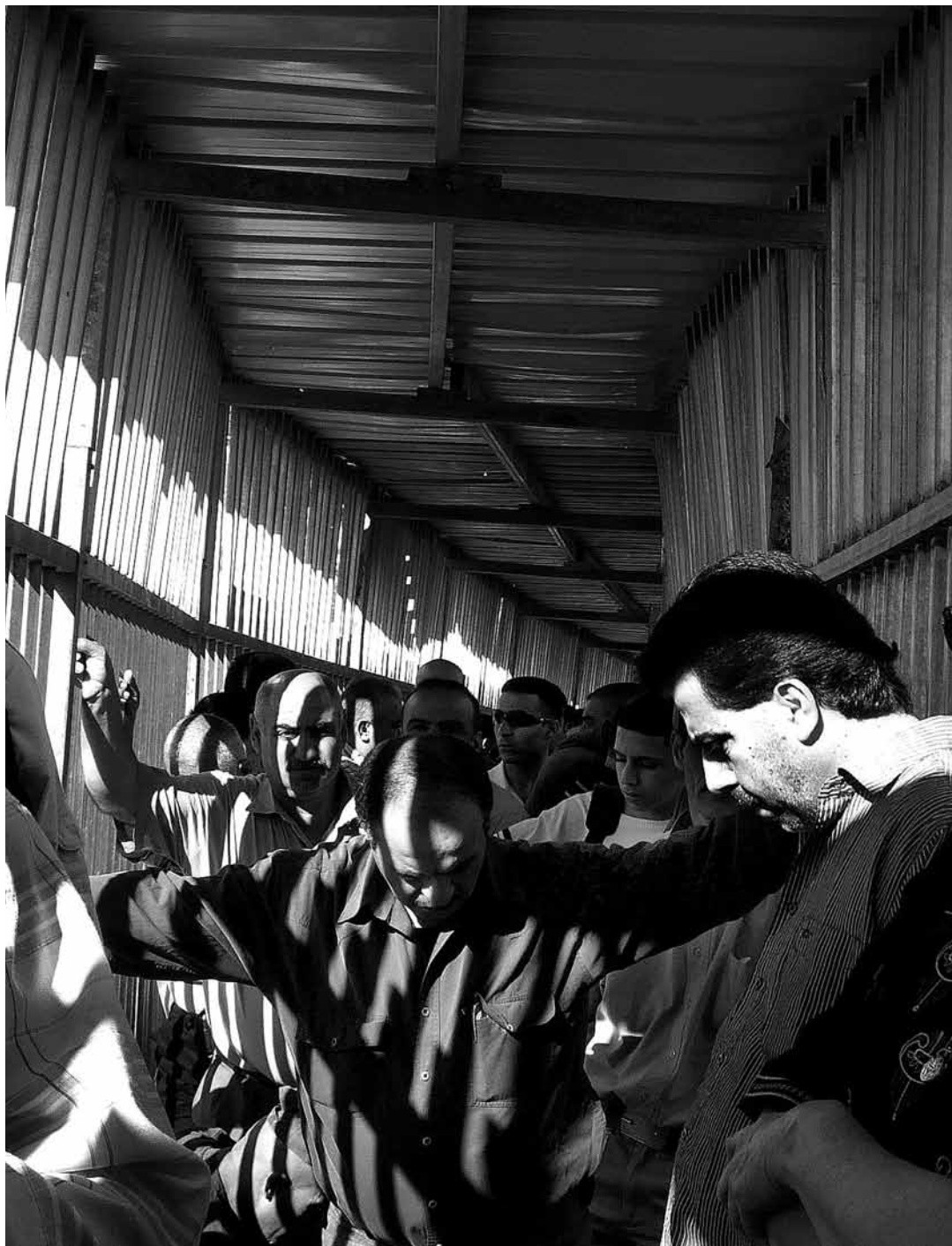
2011-10-01 07.31 Betlehem Checkpoint 300 – och alla andra dagar