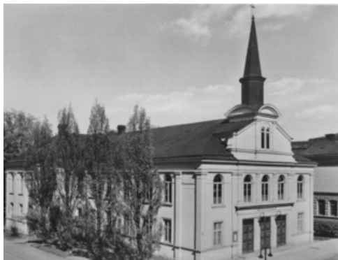
Lutherska bönhuset, Gamla Missionskyrkan

För snart 150 år sedan bildades vår församling, då med namnet Uppsala stads missionsförening. Jubileumsåret 2020 kommer att innehålla flera olika aktiviteter.